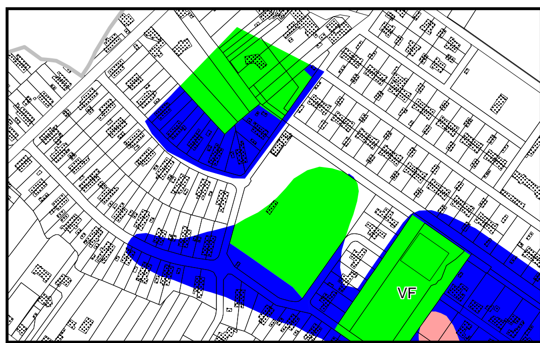
Zoom sur la zone avant modification