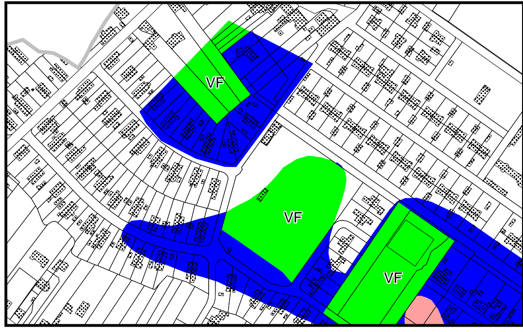
Zoom sur la zone après modification